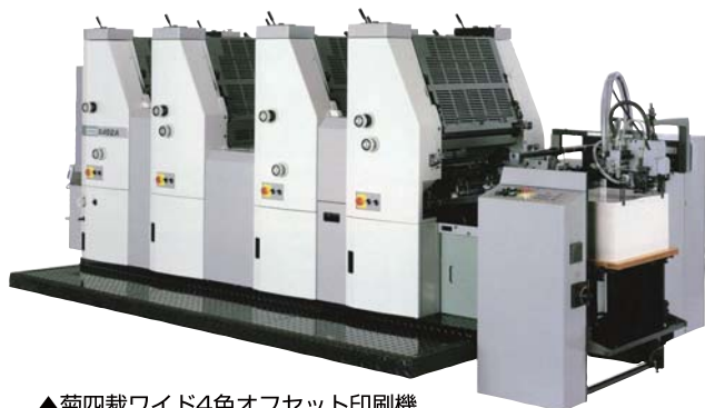
▲菊四裁ワイド4色オフセット印刷機 「HAMADA B452」