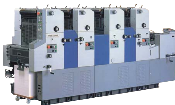
▲A3判縦通し4色オフセット印刷機 「RYOBI 3304HA」